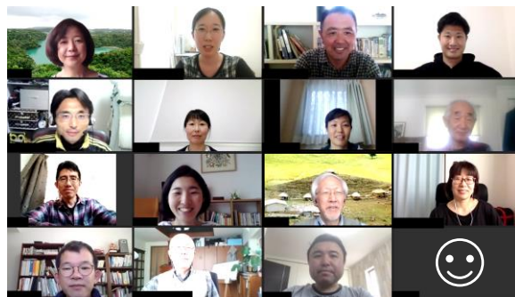
▲ 2020年度会員総会の様子 初リモート開催を実施し、2019年度 会計&活動報告を行いました。