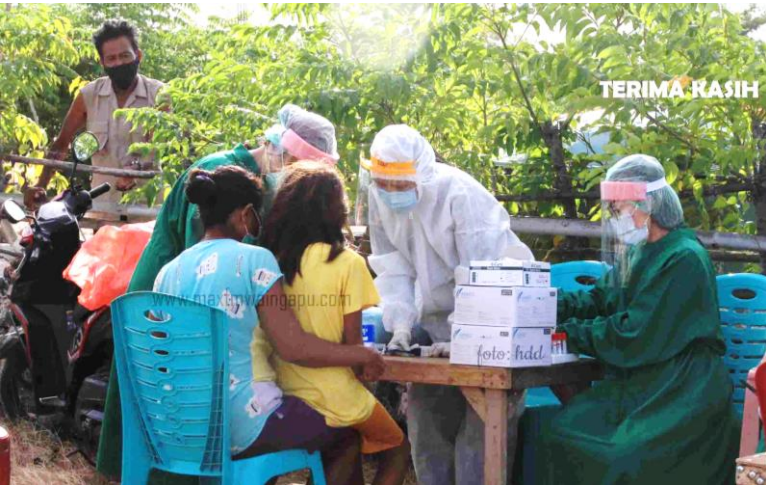
▲ 感染者が出た村人を診断する医療従事者