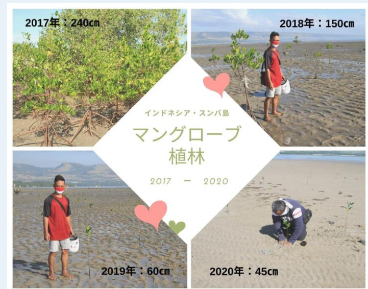
(植林した年と木の平均高さ)