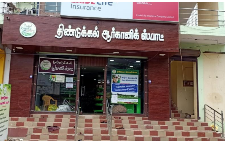
▲ ロックダウン中も州政府の指導で営業できたオーガニック野菜ショップ。