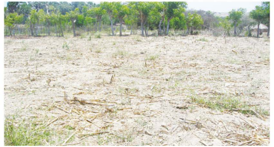
▲雨の降らない乾季は何も農作物が育たず放置される畑

LIFEは、これからも現地NGOと協力し開発から取り残され貧困に苦しむたくさんの人々に支援が行き渡るよう活動を続けていきます。皆様のご支援をLIFEスタッフ一同心よりお願い申し上げます。