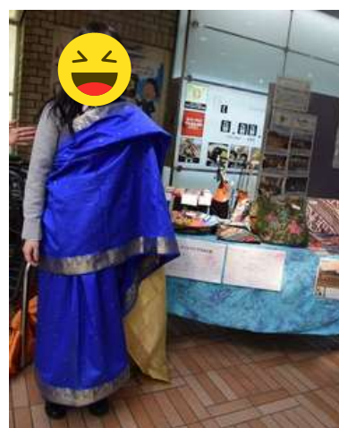
▲ 2018年2月：イベントの運営以外にもPOPの作成にも参加