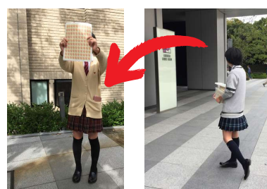
▲ 2018年：寄付されたハガキを整理し郵便局で切手に交換する資金化活動の様子