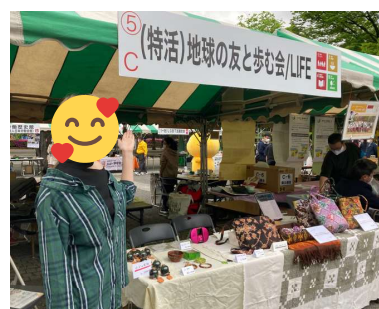
▲ 2022年4月：イベント運営は安心して任せられ頼もしい存在になりました！（職員談）