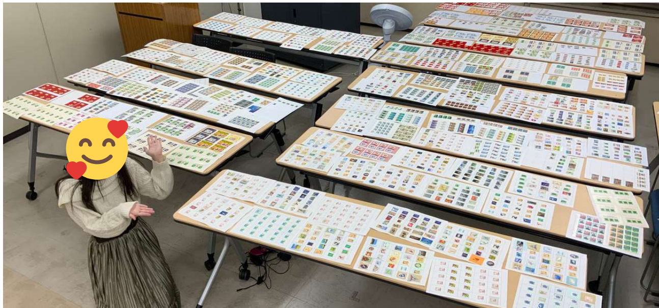
▲ 2022年11月：切手の貼り付けボランティア会にて